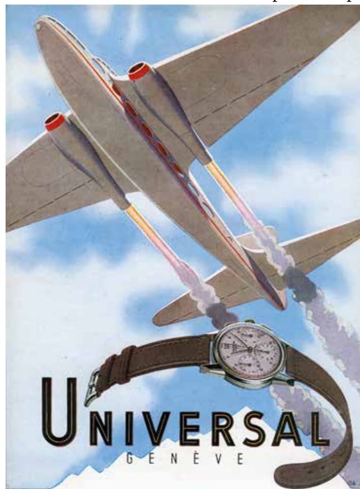
Publicité de 1948

A partir de 1930, sous l'impulsion de Raoul Perret, également administrateur de Zénith et président du conseil d'administration de la Martel Watch Co., les chronographes Universal vont conquérir le monde.